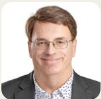
Vincent Bourassa Maire